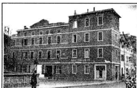
LA BELLA SISTEMAZIONE DELL'ALBERGO CORSINI