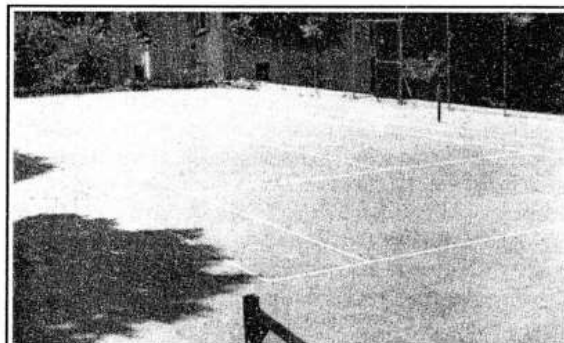
IL CAMPO DA TENNIS RIPRISTINATO